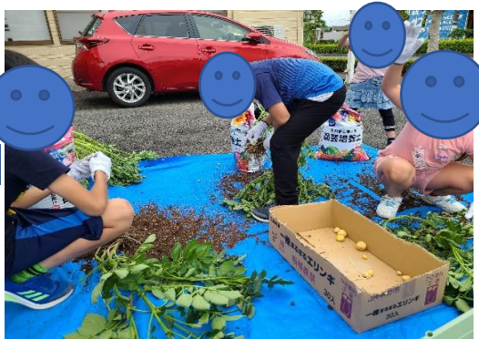
(③小さいけどじゃがいもが収穫できました)