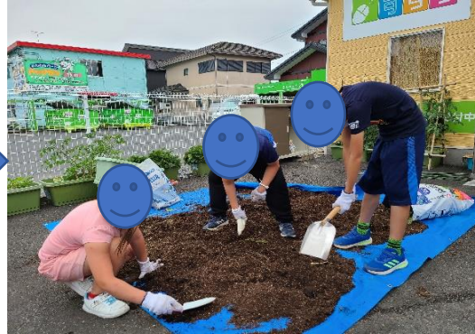
(②丁寧に土の中からじゃがいを探します)