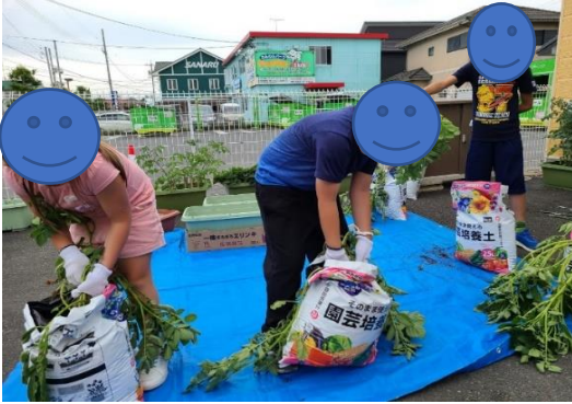
(①これからじゃがいもの収穫です)